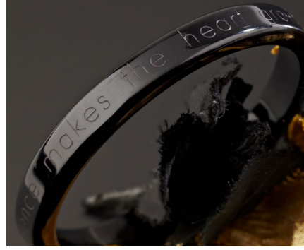
Personalisierung von Schmuck und Geschenkartikeln (Ringe, Armreife, Anhänger...)