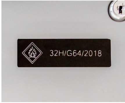
Identifikation und Rückverfolgbarkeit von Geräten