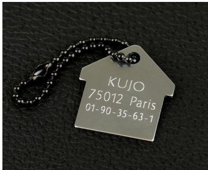
Gravur von Tieranhängern