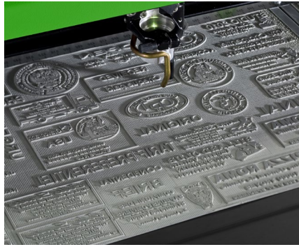
Gravieren & Schneiden von individuellen Farbstempeln