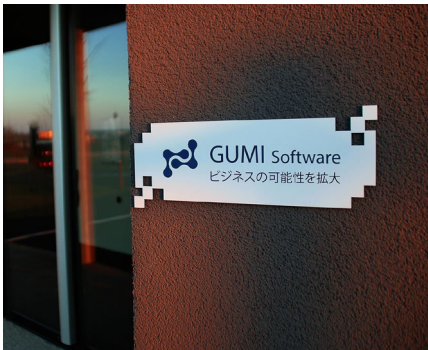
POP-Displays und Schildergravur