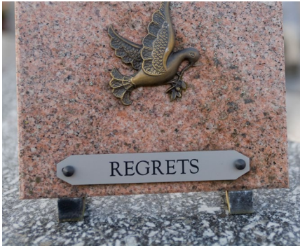
Gravur von Grabplatten und Grabsteinen