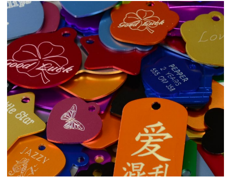
Haustier- und Hundemarkengravur