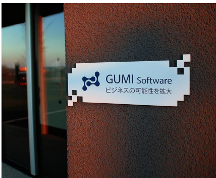
POP-Displays und Schildergravur