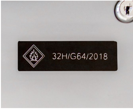
Identifikation und Rückverfolgbarkeit von Geräten