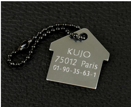
Gravur von Tieranhängern