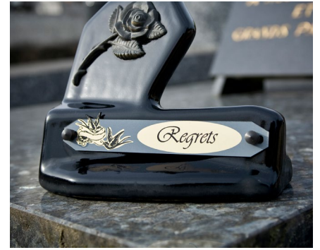
Gravur von Grabplatten und Grabsteinen