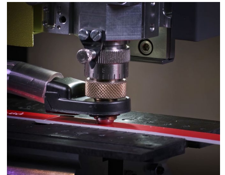
Erstellung von Typenschildern