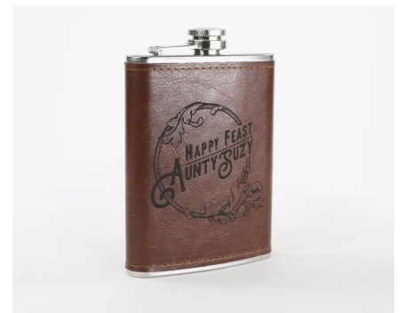
Geschenkartikel und Personalisierung