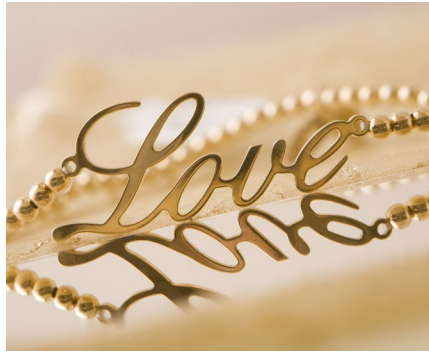
Schneiden & Gravieren