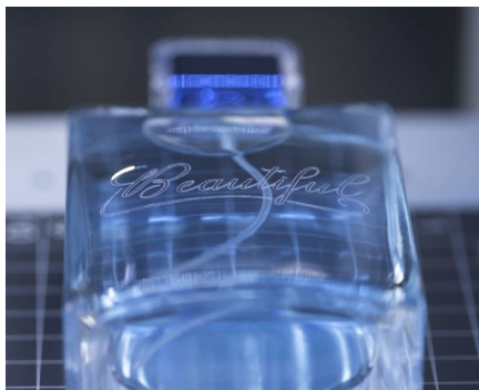
Kosmetik & Luxus