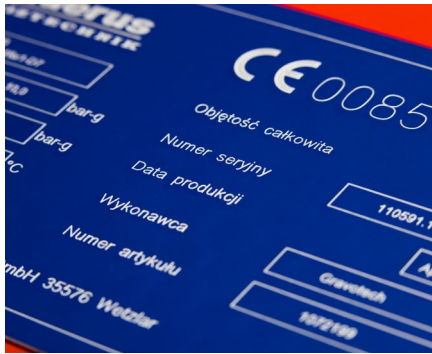
Rückverfolgbarkeit von Industrieteilen