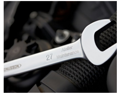
Identifizierung und Rückverfolgbarkeit von Werkzeugen