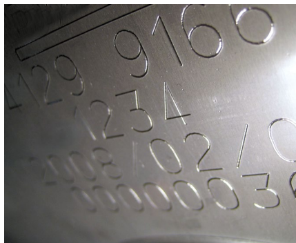
Markierung von Edelstahl