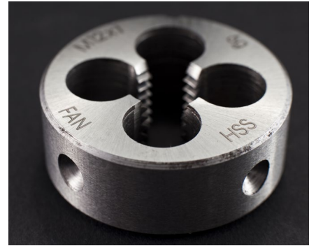
Identifikation und Rückverfolgbarkeit von Geräten