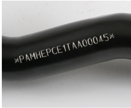
Kennzeichnung von Zylindrischen Teilen