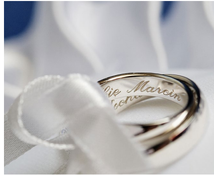
Personalisierung und Gravur von Schmuck