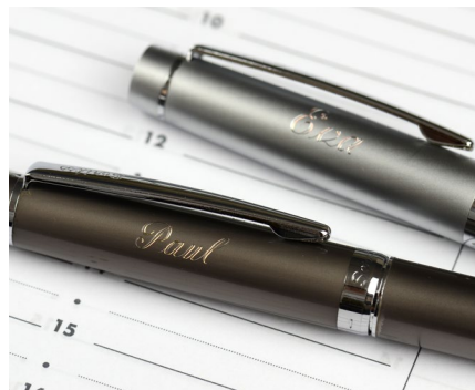
Gravur von Schreibgeräten