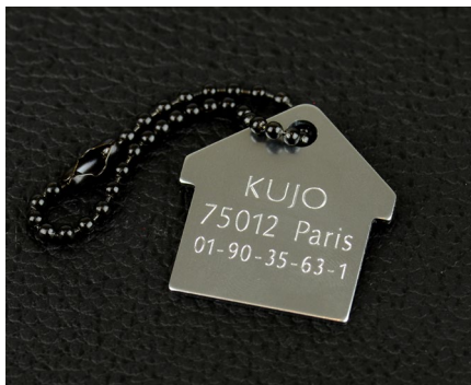
Gravur von Tieranhängern