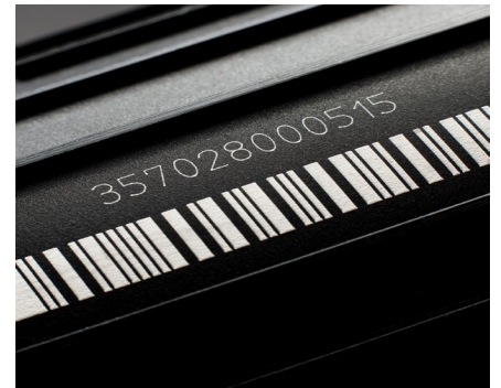
Kontrastreiche Markierung auf Kunststoff