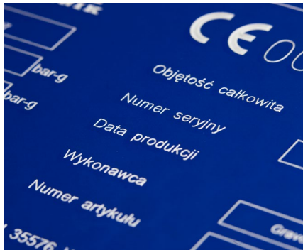
Gravur auf eloxiertem Aluminium