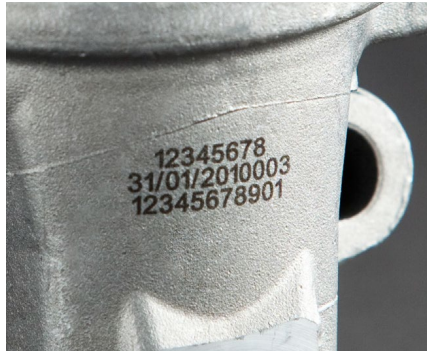
Identifizierung und Rückverfolgbarkeit von Teilen